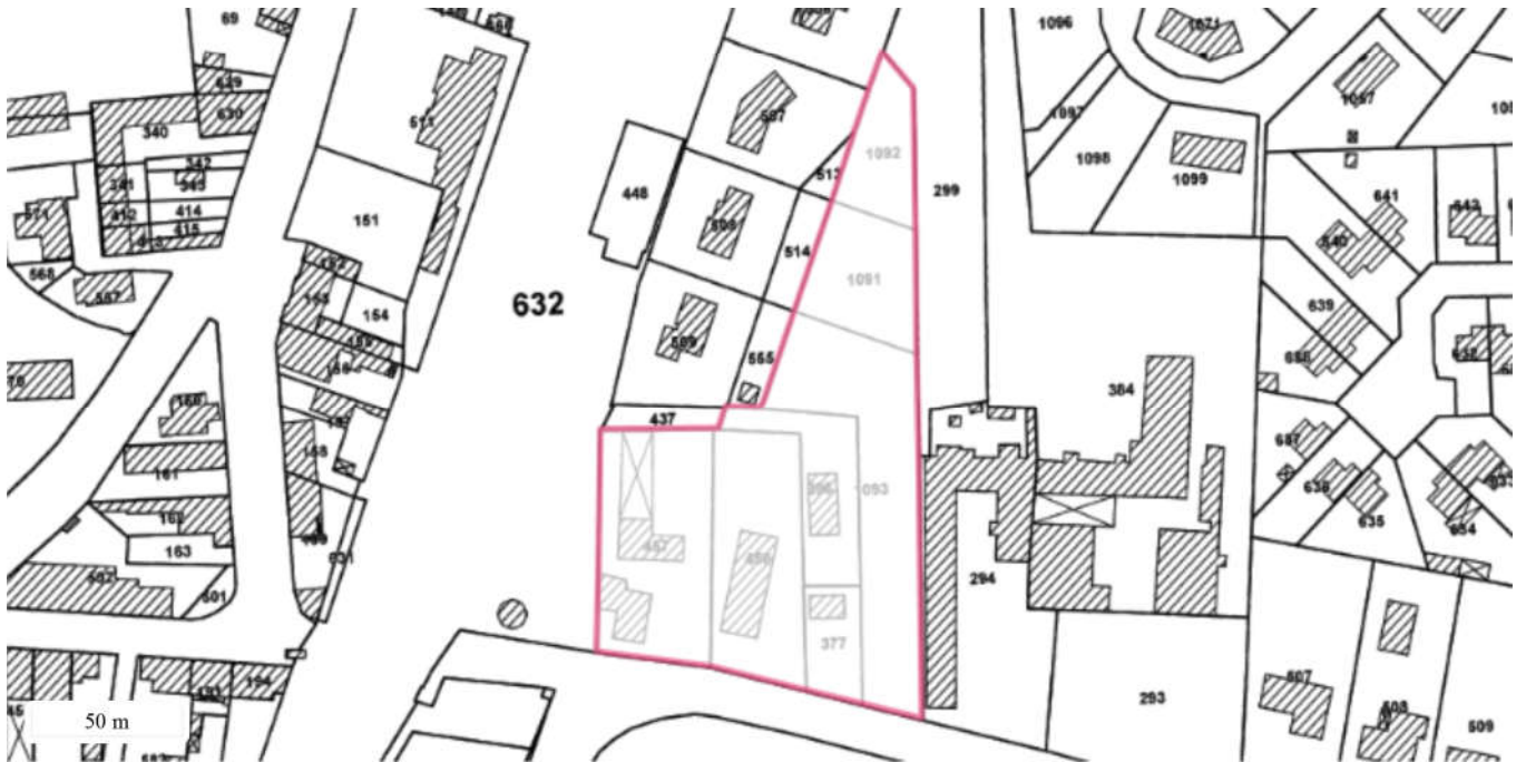
Périmètre du SIS Parcelles cadastrales - IGN